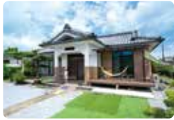
趣きのある外観は補修のみにとどめ、リビングと庭を緩やかにつなぐデッキを後付け。屋外スペースでの食事や遊びも増えたそう。

るのも荒場家の特徴。壁紙を貼ったり、漆喰壁を塗ったりと、2ヶ月かけて整えたと言います。ただ、まだ完成ではなく、改修の真っ最中なのだから。「いま着手している廊下は子供たちも漆喰塗りに参加。私たちが建物と土地を大事にして、住み継いだ建物と土地を大事にして、家族が仲良く、楽しく暮らしていきたいですね」。