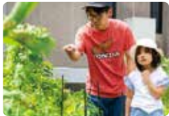
敷地内の菜園では複数の野菜を栽培。みんなで育てて収穫を行い、美味しく食べるという、おうち時間の新たな楽しみが生まれた。